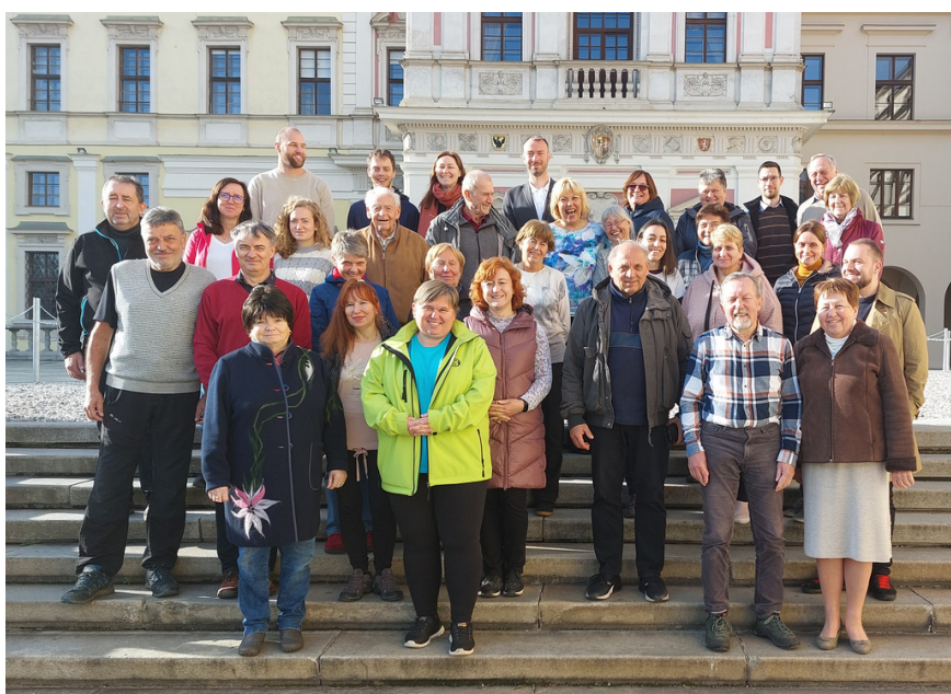
Fotografie ze srazu župních zdravotníků 12. 11. 2022.