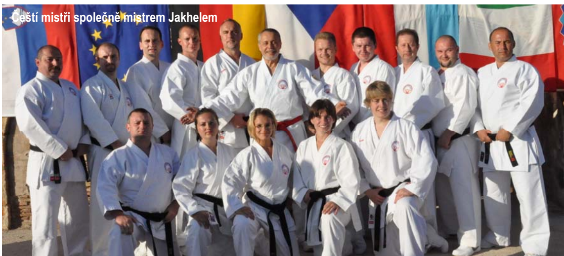
Čeští mistři společně mistrem Jakhelem