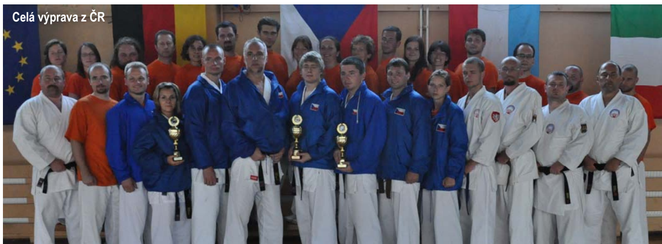
Celá výprava z ČR