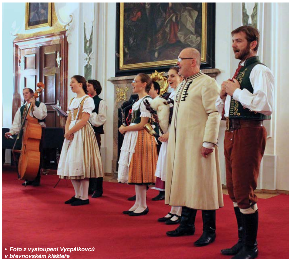
• Foto z vystoupení Vycpálkovců v břevnovském klášteře

Muzika Souboru písní a tanců Josefa Vycpálka již pravidelně poslední měsíce roku zpestřuje pomalu se blížící předvánoční a vánoční čas. Nejinak je tomu i letos. V listopadu se veřejnosti představila ve dvou vystoupeních. Nejprve 12. listopadu se Vycpálkovci zúčastnili setkání lidových muzik v Městské knihovně hl. m. Prahy – zde vystoupili s programem nazvaným „V hospodě je život Čechů“.