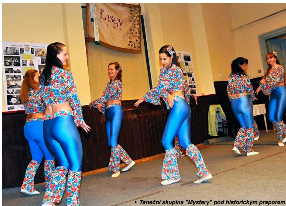
• Taneční skupina "Mystery" pod historickým praporem