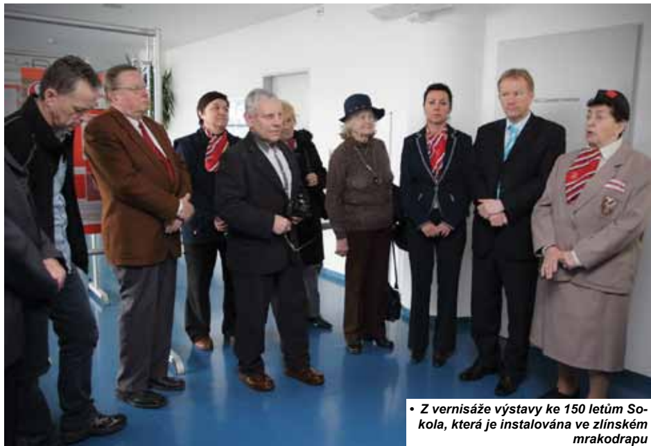
• Z vernisáže výstavy ke 150 letům Sokola, která je instalována ve zlínském mrakodrapu