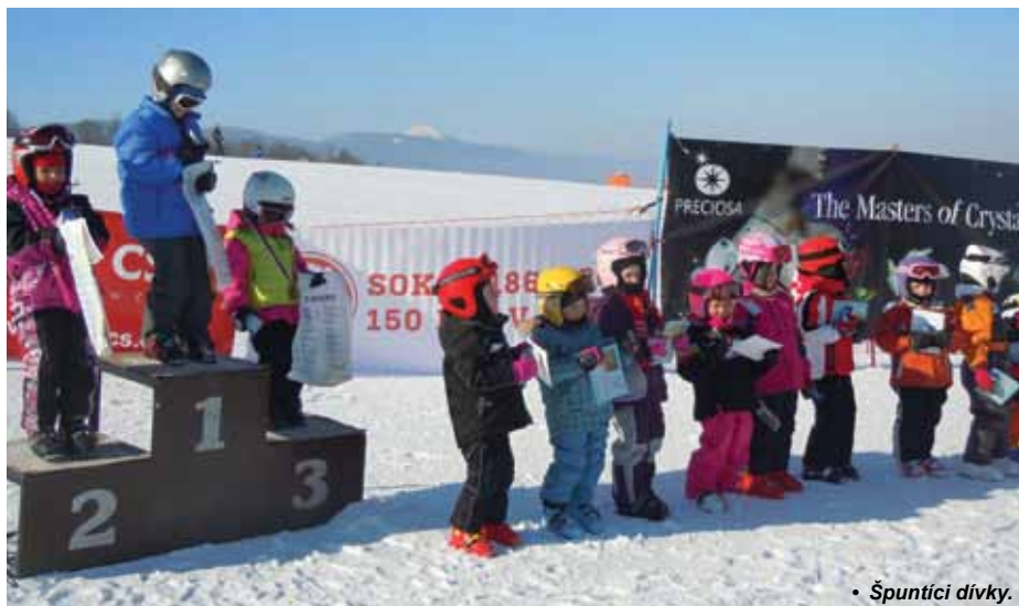
• Špuntící dívky.

Druhý únorový víkend již tradičně patřil lyžařským závodům, které pořádal T.J. Sokol Frýdštejn spolu s dalšími partnery. Ve dnech 11.–12. února je hostil perfektně fungující Rekreačně sportovní areál Obří sud – Javorník.