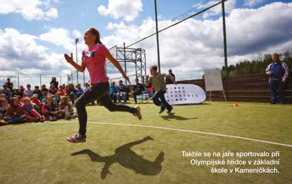
Takhle se na jaře sportovalo při Olympijské hlídce v základní škole v Kameničkách.