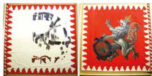
Inv. č.: H7H-33893, Prapor Sokola Příbram, Sbírká tělesné výchovy a sportu, Národní muzeum.

Historický prapor Sokola Příbram se dnes nachází v depozitáři Národního muzea v Terezíně, ve sbírkách tělesné výchovy a sportu pod inventárním číslem H7H-33893