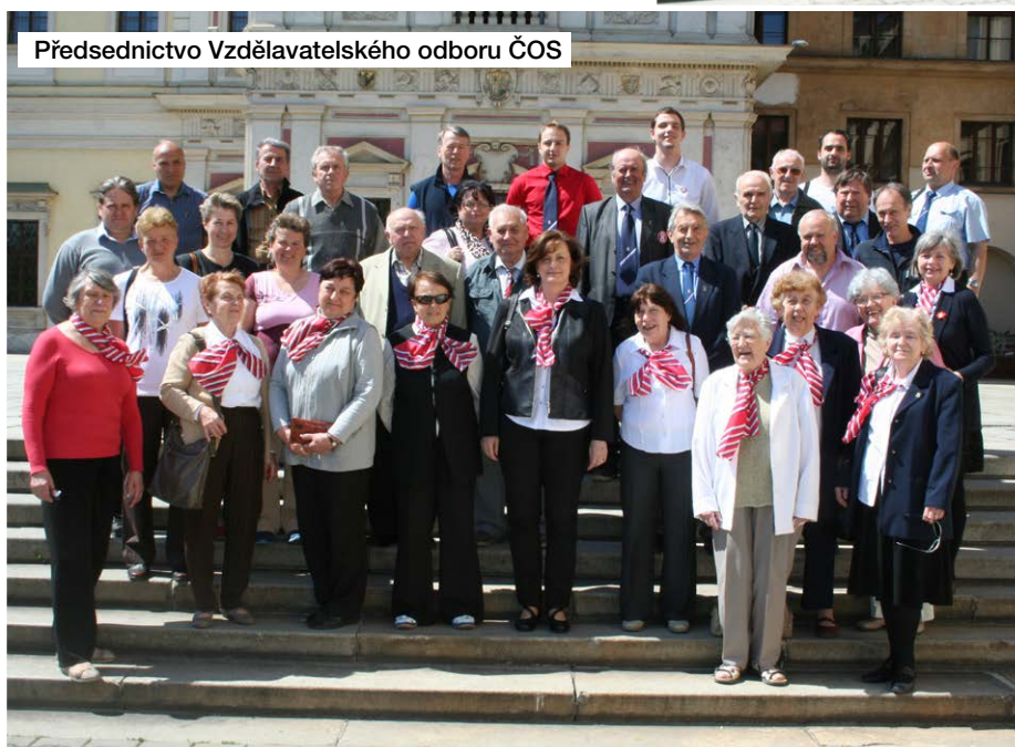
Předsednictvo Vzdělavatelského odboru ČOS