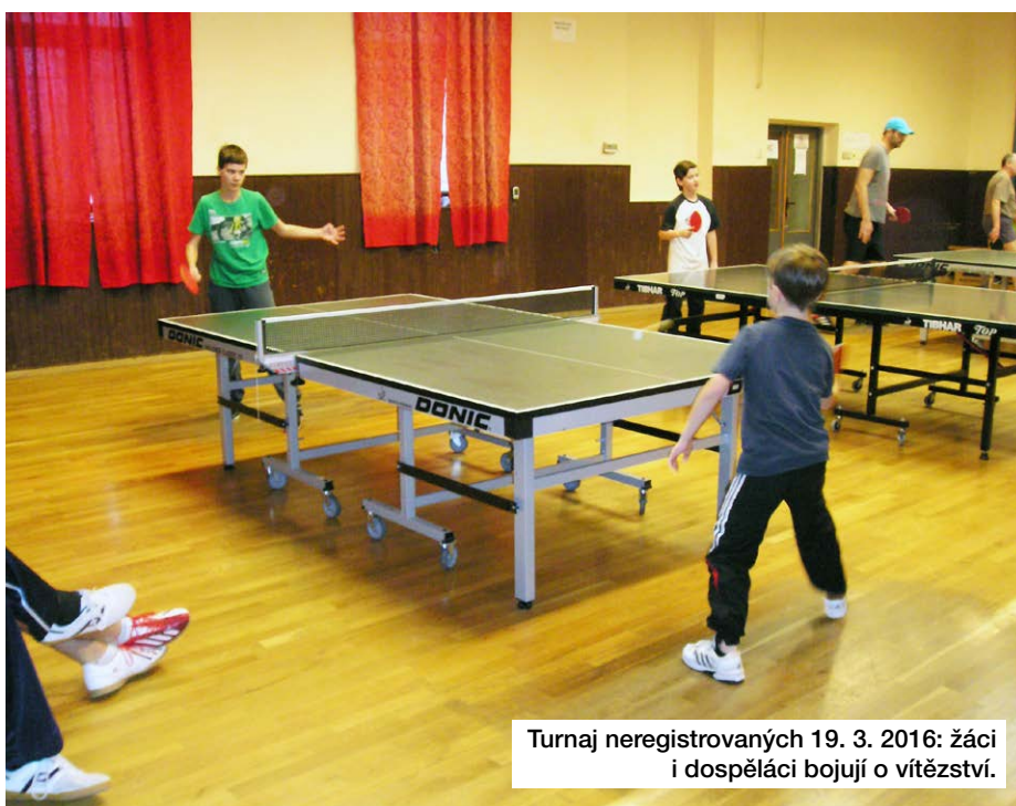
Turnaj neregistrovaných 19. 3. 2016: žáci i dospěláci bojují o vítězství.