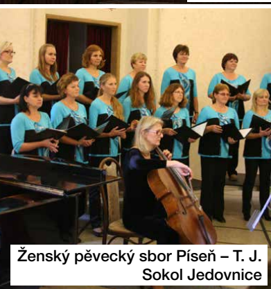
Ženský pěvecký sbor Píseň – T. J. Sokol Jedovnice