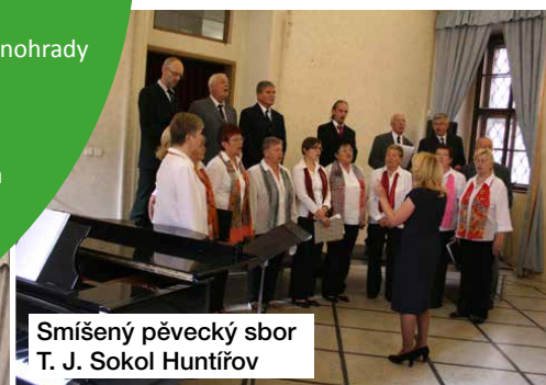
Smíšený pěvecký sbor T. J. Sokol Huntířov