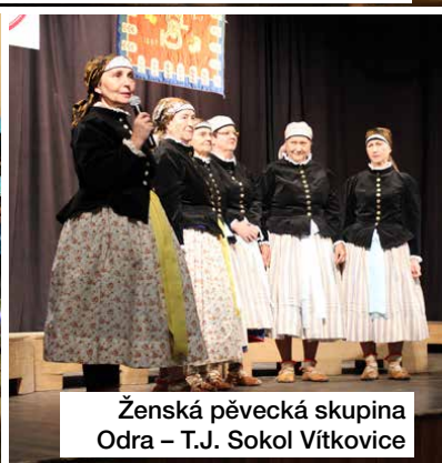
Ženská pěvecká skupina Odra – T.J. Sokol Vítkovice