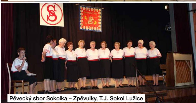
Pěvecký sbor Sokolka – Zpěvulky, T.J. Sokol Lužice