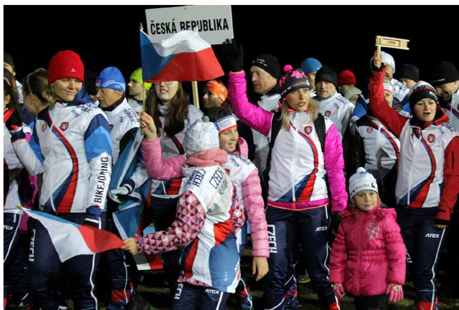
Tým canicross – česká reprezentace