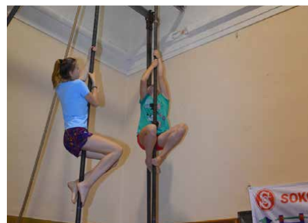
Sokol Praha Vršovice