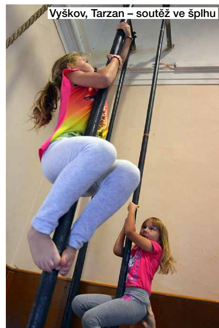
Vyškov, Tarzan – soutěž ve šplhu

bu“ byla i Noc sokoloven, která nabídl možnost seznámit se se svěbytnou architekturou sokoloven, ale také s různorodou činností Sokola. Letošní druhý ročník Noci sokoloven se konal v pátek 23. září, kdy několik desítek sokoloven po celé republice se otevřelo všem zájemcům, kteří si chtěli sokolovny prohlédnout, nebo se seznámit s činností konkrétní tělocvičné jednoty, případně si sami vyzkoušet některé pohybové aktivity. O Noci sokoloven píšeme v následujícím samostatném článku.