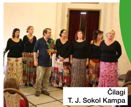
Čilagi T. J. Sokol Kampa