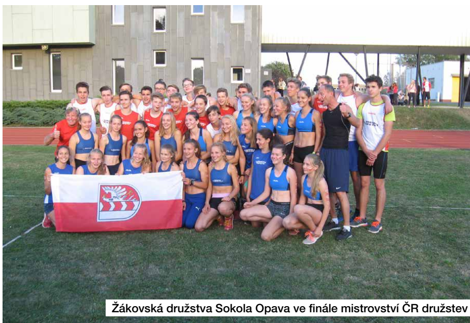
Žákovská družstva Sokola Opava ve finále mistrovství ČR družstev