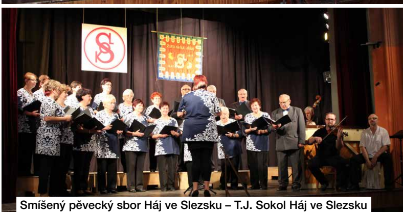
Smíšený pěvecký sbor Háj ve Slezsku – T.J. Sokol Háj ve Slezsku