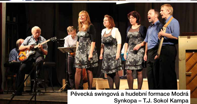
Pěvecká swingová a hudební formace Modrá Synkopa – T.J. Sokol Kampa