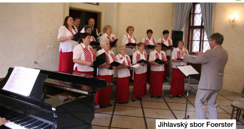
Jihlavský sbor Foerster