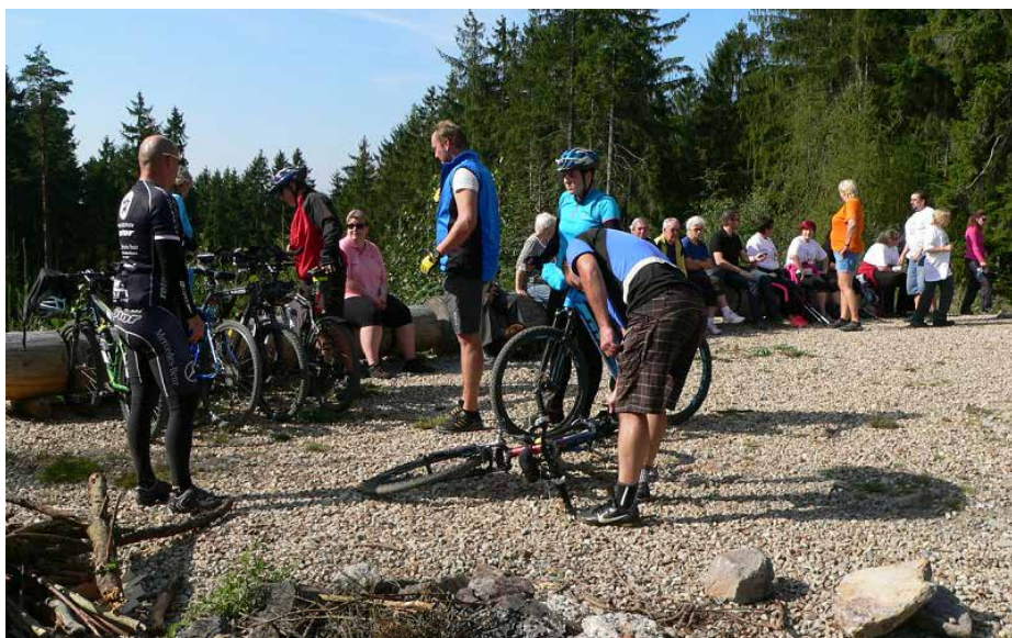
Župa Rokycanova – se Sokolem na rozhlednu

Akce projektu „Sokol spolu v pohybu“ se konaly především v týdnu od 19. do 25. září. Po celý uvedený týden se každý den po celé republice v rámci tohoto projektu představily různé cvičební a kulturní aktivity. V pondělí to byly především aktivity pro seniory, úterý bylo dnem pro nejmenší děti a rodiče, středa byla ve znamení dne zdraví a spolupráce s handicapovanými, čtvr-