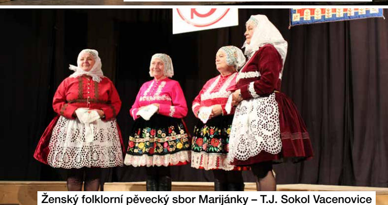
Ženský folklorní pěvecký sbor Marijánky – T.J. Sokol Vacenovice