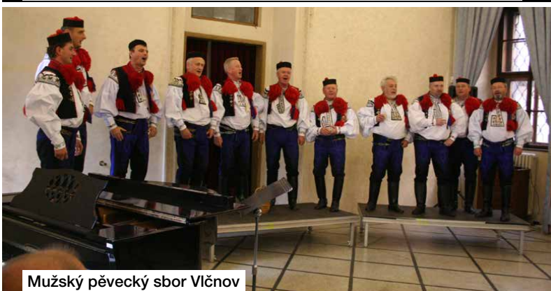
Mužský pěvecký sbor Vlčnov