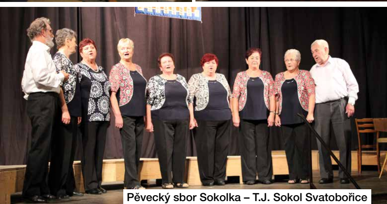
Pěvecký sbor Sokolka – T.J. Sokol Svatobořice