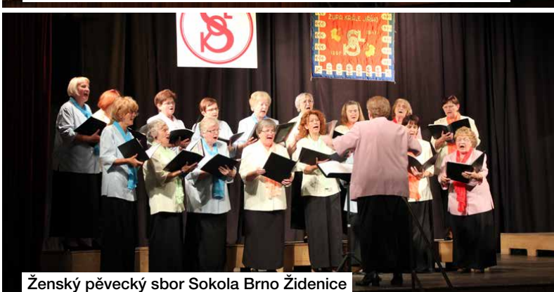
Ženský pěvecký sbor Sokola Brno Židenice